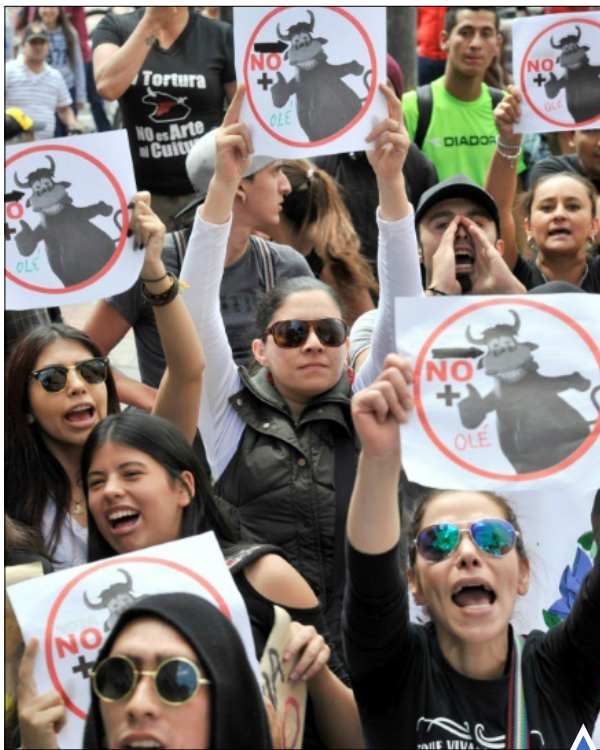
تظاهرات مخالفان گاوپازی در کلمبیا