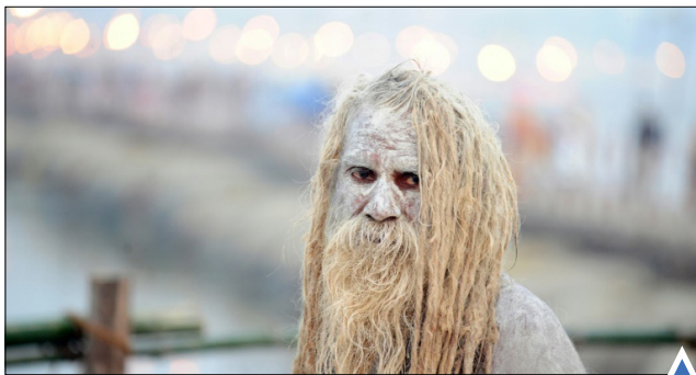
مرد هندو در رود گنگ