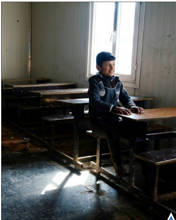
بازگشت پسر عراقی به مدرسه در موصل