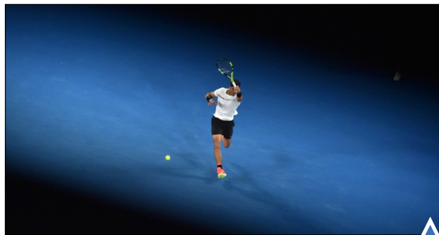
رافائل نادال در مسابقه