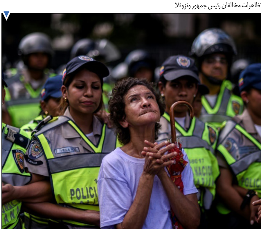
تظاهرات مخالفان رئیس جمهور ونزواتا