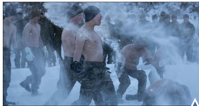
تمرین مشترک نیروهای کره جنوبی و آمریکا در نزدیکی ستول