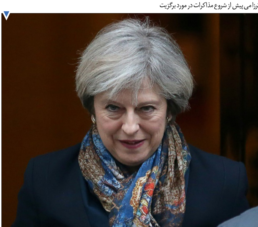
ترزای پیش از شروع مذاکرات در مورد برگزیت