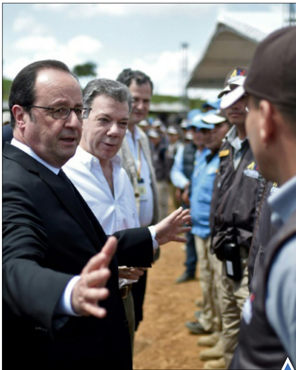
رؤسای جمهوری فرانسه و کلمبیا در بازدید از اردوگاه گروه فارک