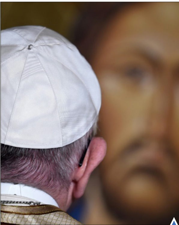
پاپ در کلیسا

تماشای فیلم فروشنده در میدان ترافالگار لندن