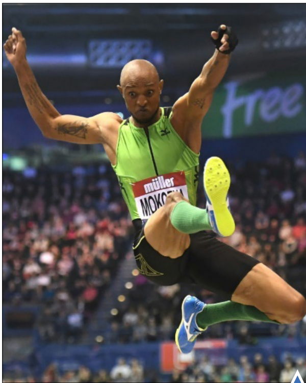
ورزشکاری از آفریقای جنوبی در مسابقه پرش؛ بیرمنگام