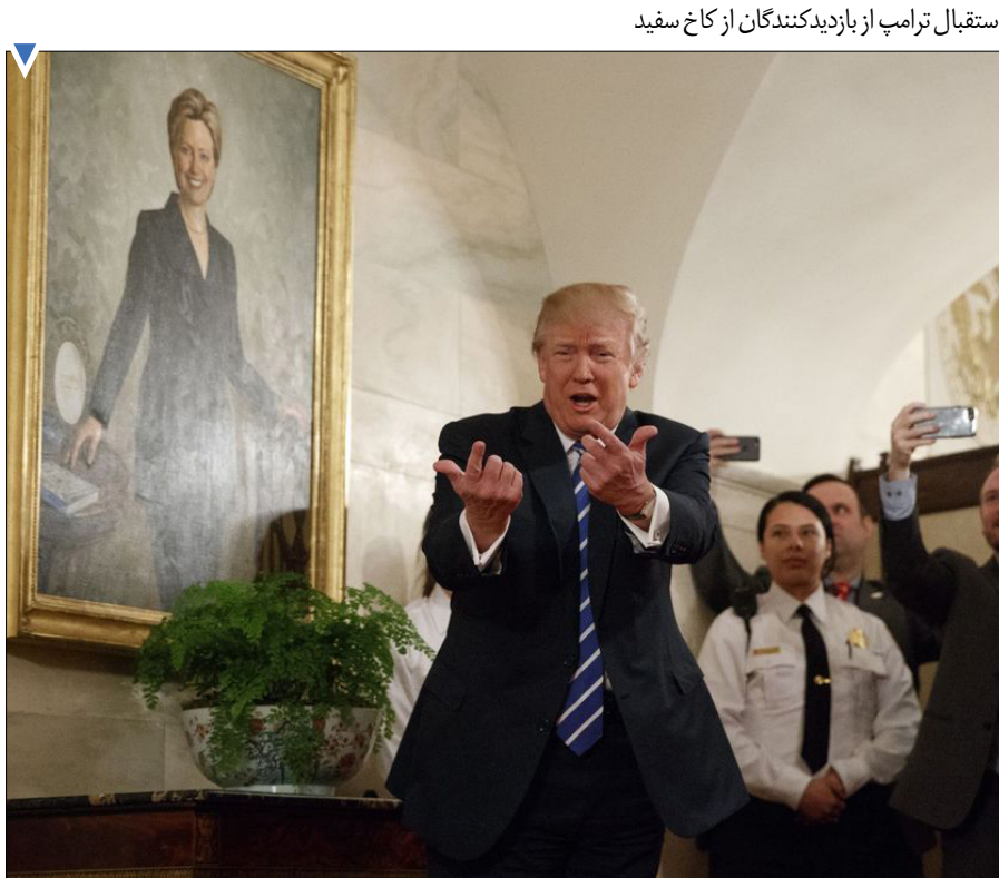
استقبال ترامپ از بازدیدکنندگان از کاخ سفید