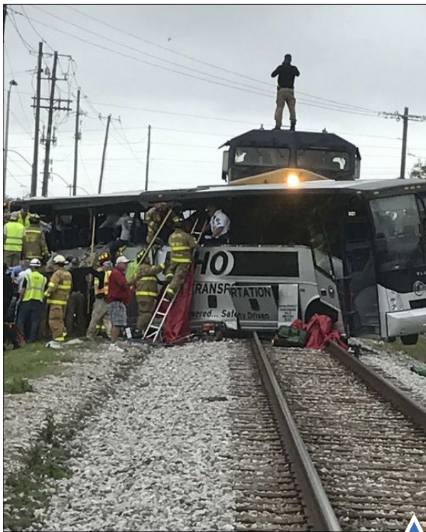
تصادف اتوبوس با قطار؛ می‌سی‌سی‌پی