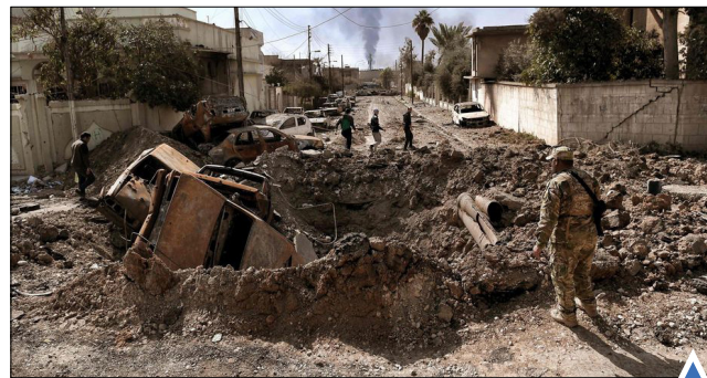
حمله هوایی در موصل مقابل دریای طوفانی؛ نیس، فرانسه