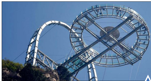
سکوی شیشه‌ای محلی دیدنی برای گردشگران شهر پکن چین