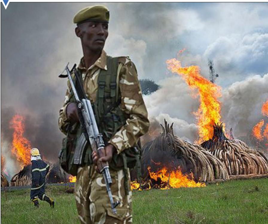
آتش زدن عاچ‌های فیل برای جلوگیری از قاچاق غیرقانونی در کنیا