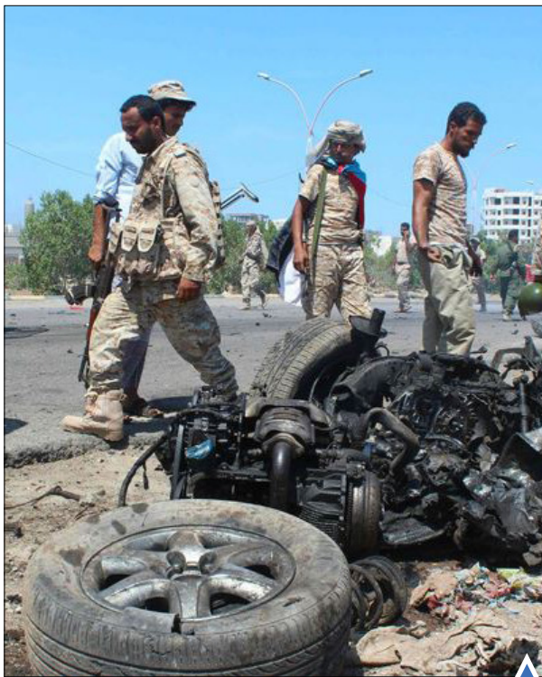
محل انفجار خودروی بمب گذاری شده در عدن، یمن