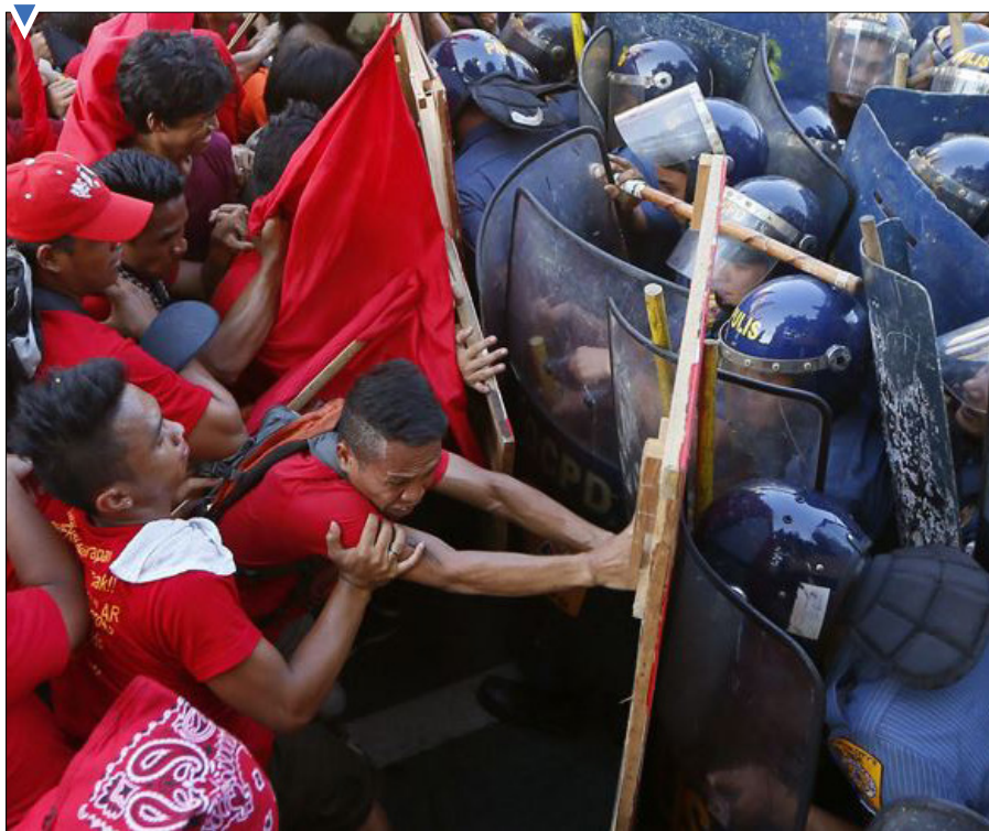
تظاهرات مردم فیلیپین مقابل سفارت آمریکا در مانیل