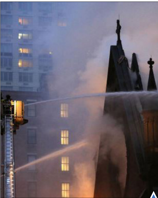
آتش سوزی در کلیسای تاریخی نیویورک

تجمع نوازندگان لهستانی برای ثبت رکوردی جدید در گینس