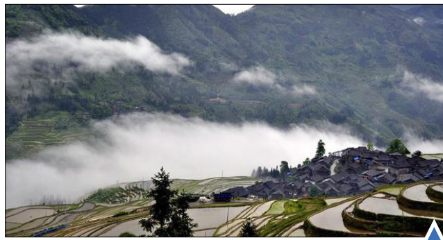
روستایی با شالیزارهای پلکانی در چین

ادامه اعتراض مردم فرانسه به اصلاحات قانون کار