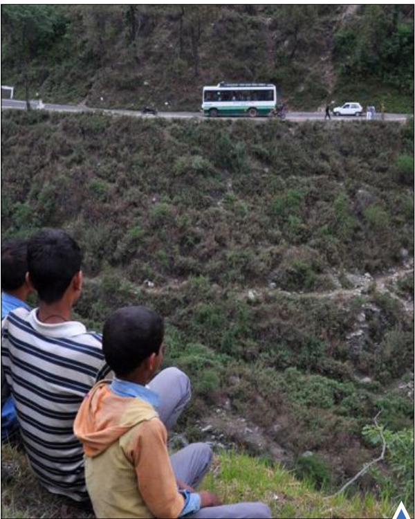
تماشای اتوبوس واژگون در دره؛ این حادثه ۱۲ کشته و ۴۰ زخمی داشت؛ هند

پسری در خانه‌ای که پس از پرتاب راکت آسیب دیده؛ شهر مرزی کیلیس، ترکیه