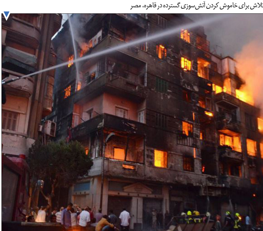
تلاش برای خاموش کردن آتش سوزی گسترده در قاهره، مصر