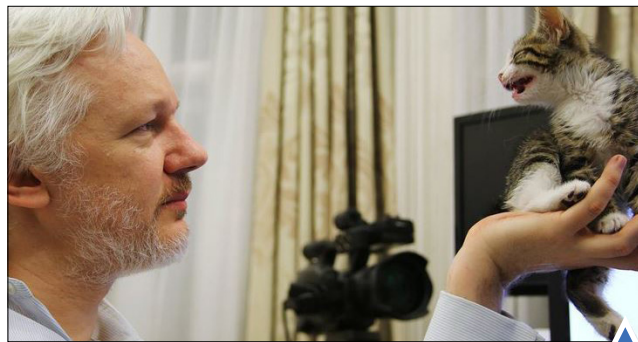
جولیان آسانز، موسس ویکی لیکس با گرهبه اهدایی فرزندانش در سفارت اکوادور؛ لندن