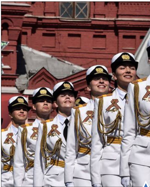
رژه نظامی روز پیروزی در میدان سرخ مسکو، روسیه