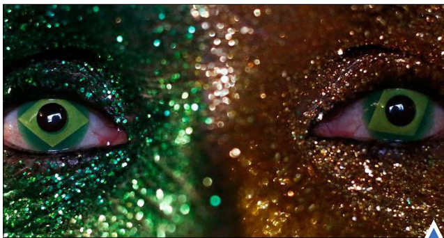
یکی از تظاهرکنندگان در حمایت از استیضاح دیپما روسف، رئیس‌جمهور در جزیره شیلونه، شیلی