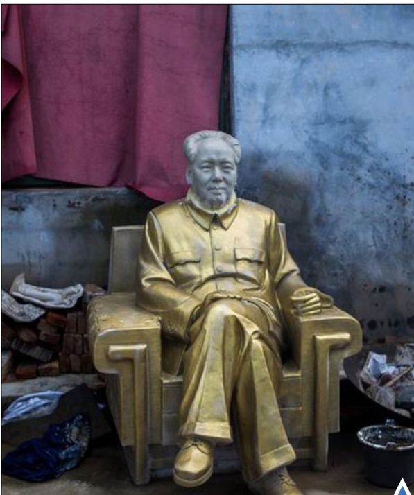
مجسمه مانو تسه تونگ در حیاط خلوت یک کارخانه که مخصوص خاطرات انقلاب فرهنگی است