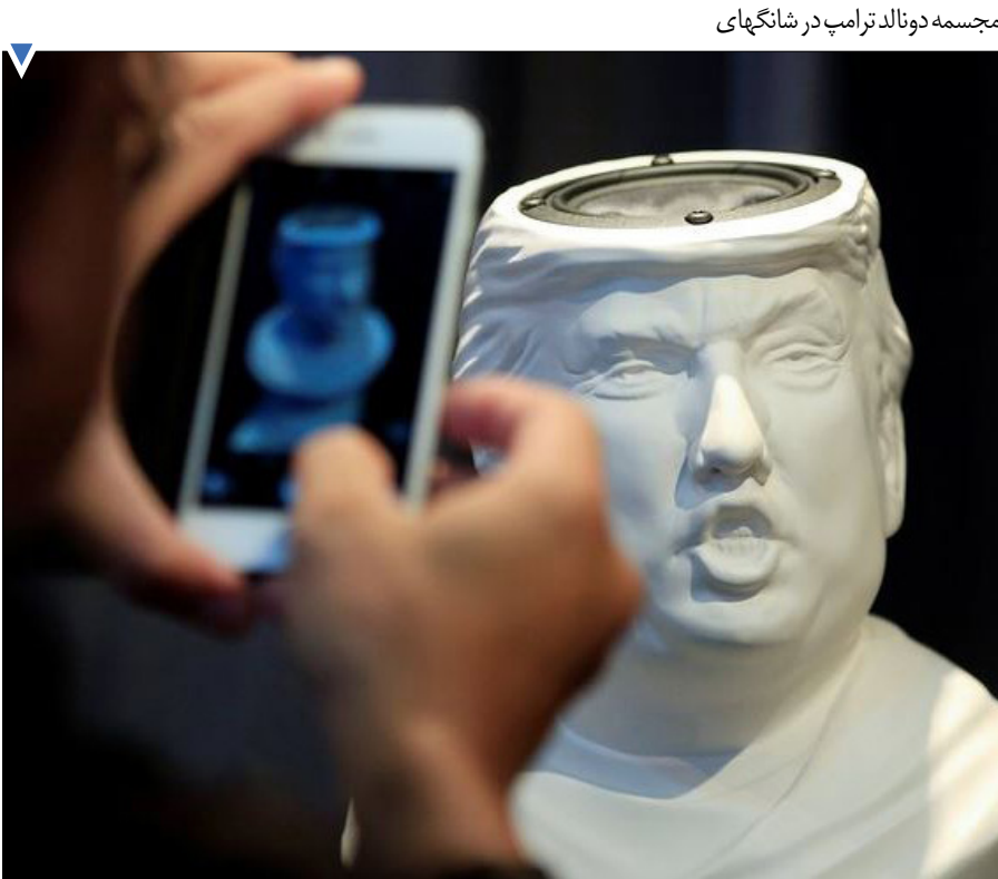
مجسمه دونالد ترامپ در شانگهای