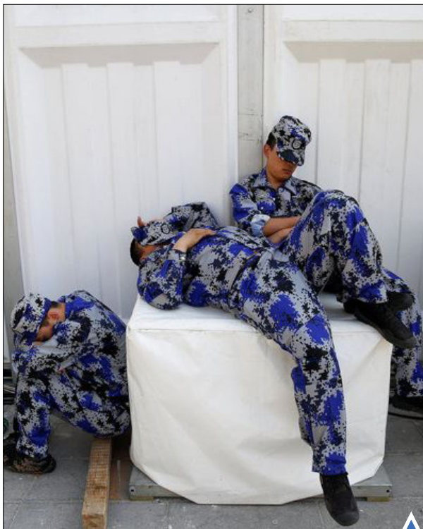
چرت نیروهای امنیتی در نمایشگاه خودروی چین در پکن