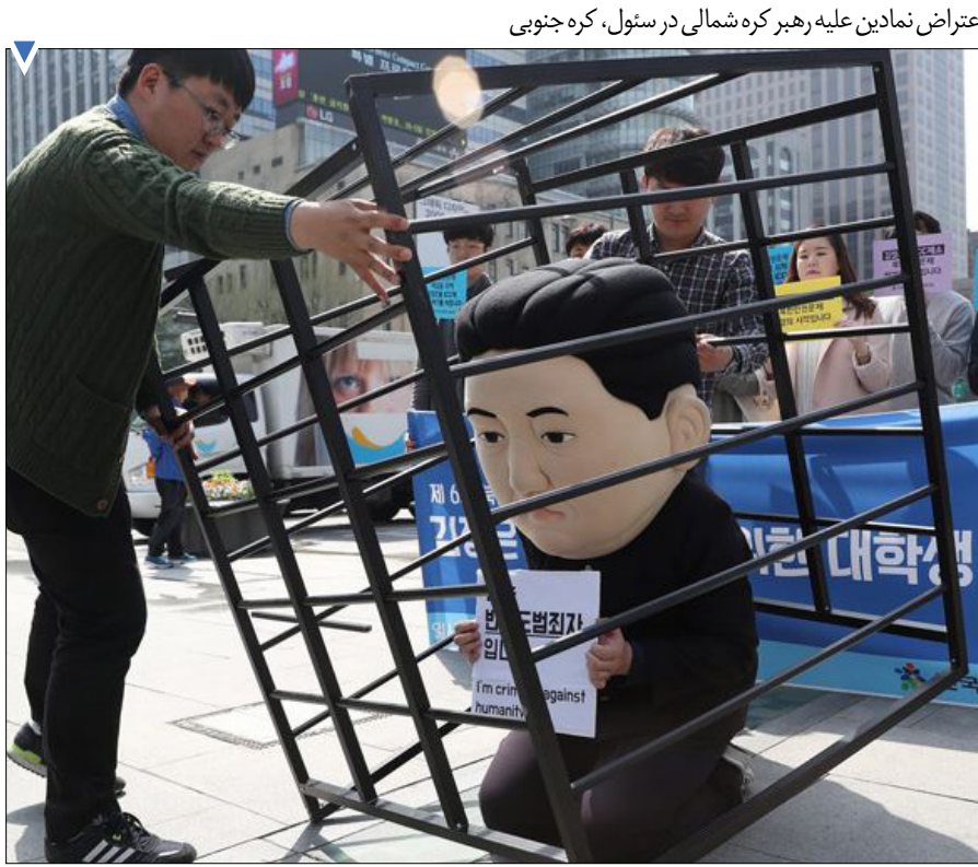
اعتراض نمادین علیه رهبر کره شمالی در ستول، کره جنوبی