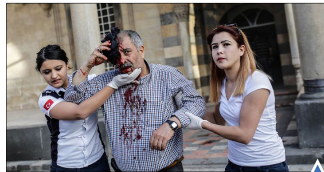
حمله راکتی داعش به مسجد در شهر مرزی کلیس ترکیه