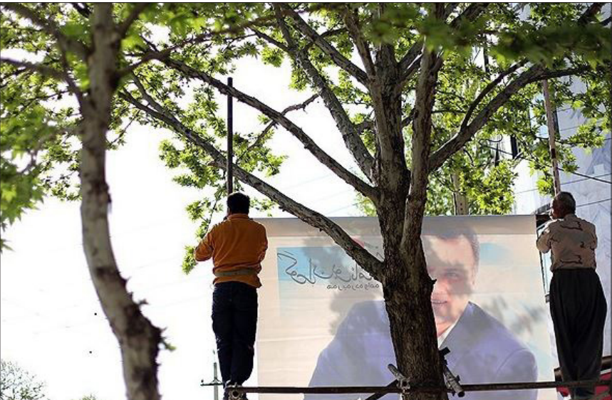
تبلغات دور دوم انتخابات مجلس در سنج و شیراز