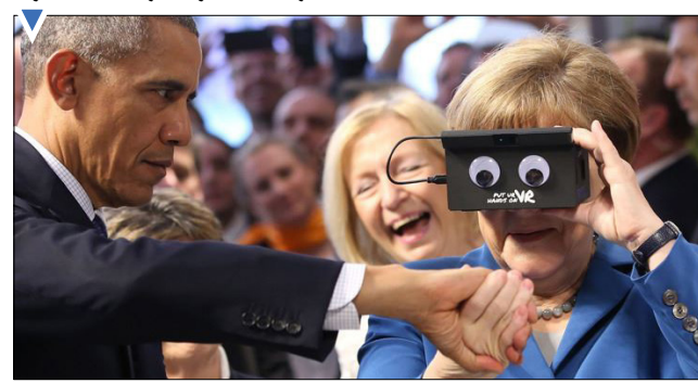
مکرل در حال تست کردن هدست واقعیت مجازی با دست اوپاما در نمایشگاه هانوف