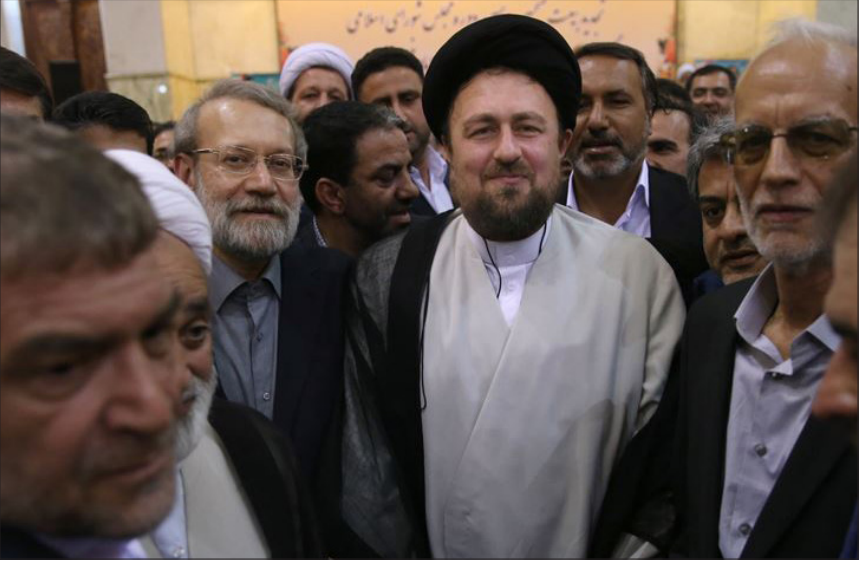
تجدید میثاق نمایندگان مجلس شورای اسلامی با امام (ره)