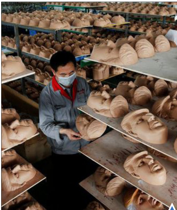
ساخت ماسک «دونالد ترامپ» نامزد انتخابات ریاست جمهوری آمریکا