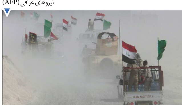
عملیات آزاد سازی فلوجه به دست نیروهای عراقی