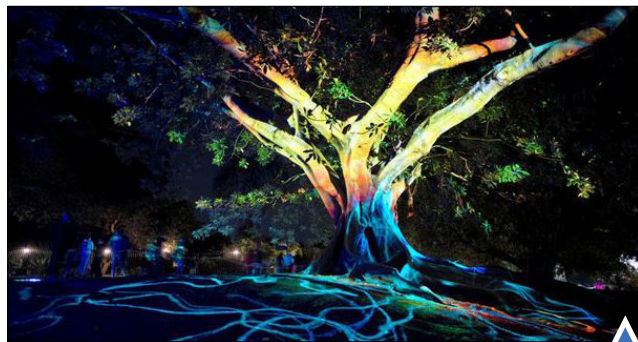
جشنواره نور در باغ گیاه‌شناسی سیدنی