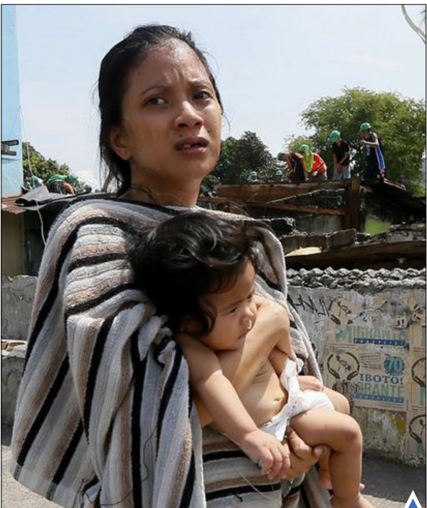
مادر و فرزند فیلیپینی پس از آنکه خانه‌شان به دلیل غیرقانونی بودن توسط دولت تخریب شد