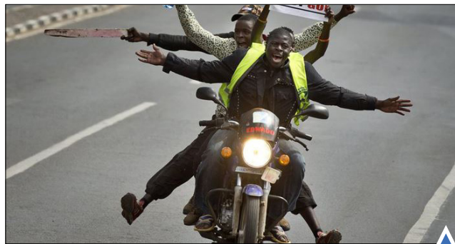
درخواست مردم برای انحلال کمیسیون انتخابات ملی به اتهام قایق تفریحی بر روی دریاچه؛ سیچوان چین فساد؛ ناپروبی، کنیا