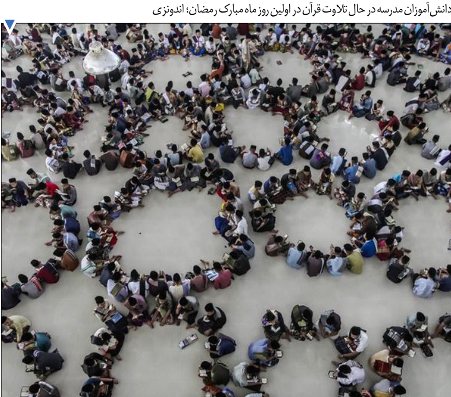
دانش‌آموزان مدرسه در حال تلاوت قرآن در اولین روز ماه مبارک رمضان؛ اندونزی