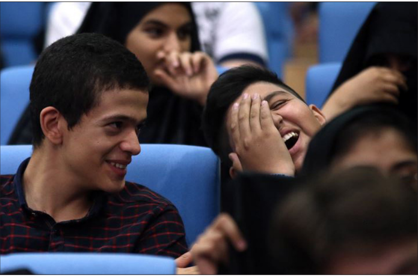
عکس روز / خنده‌های