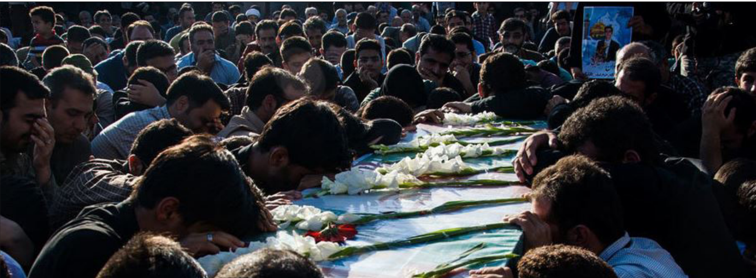
تشییع پیکر مطهر