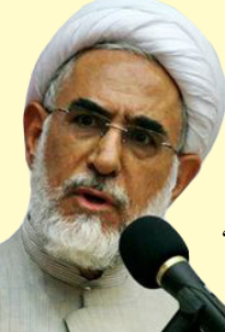
روحانی در جریان دیدار با اعضای هیئت‌مدیرهٔ مجلس شورای اسلامی

وی تأکید کرد دادستانی تهران با کسانی که فیلم‌های سینمایی در شبکه‌های ماهواره‌ای ضد انقلاب و معاند را تبلیغ نمایند برخورد می‌کند و در صورت تبلیغ در شبکه‌های ماهواره‌ای معاند از اکران اینگونه فیلم‌ها با همکاری دستگاه‌های ذی‌ربط جلوگیری خواهد شد.