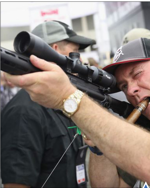
امتحان اسلحه در نمایشگاه سالانه؛ لوئیزیول، آمریکا