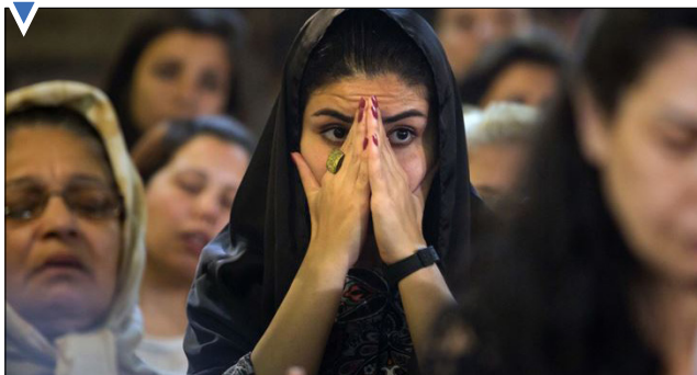
سوکواری مسیحیان برای قربانیان سقوط هواپیما در مصر