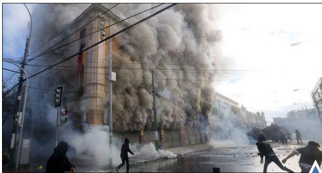
تظاهرات در شیلی