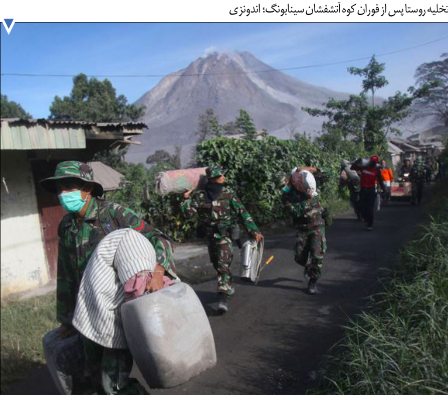
تخلیه روستا پس از فوران کوه آتشفشان سیناپونگ؛ اندونزی