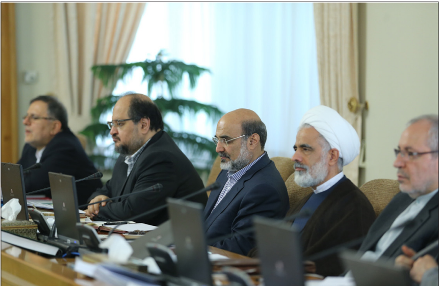
اولین حضور رئیس جدید صدا و سیما در جلسه هیات دولت