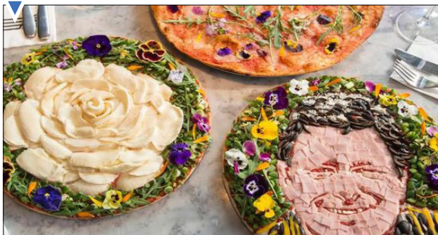
ساخت پیتزای سبزیجات همزمان با جشنواره گل و گیاه در انگلیس (wsj)