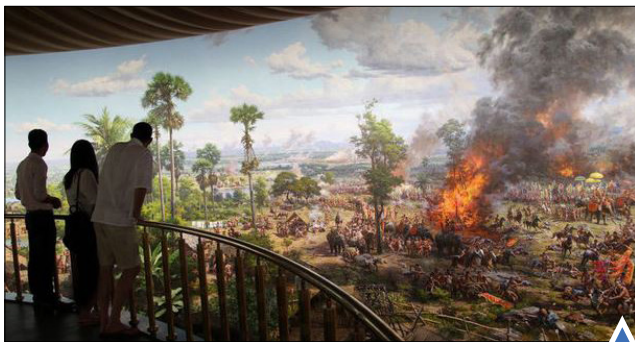
نقاشی دیواری روی دیوار موزه «پانوراما انگور» در کامبوج