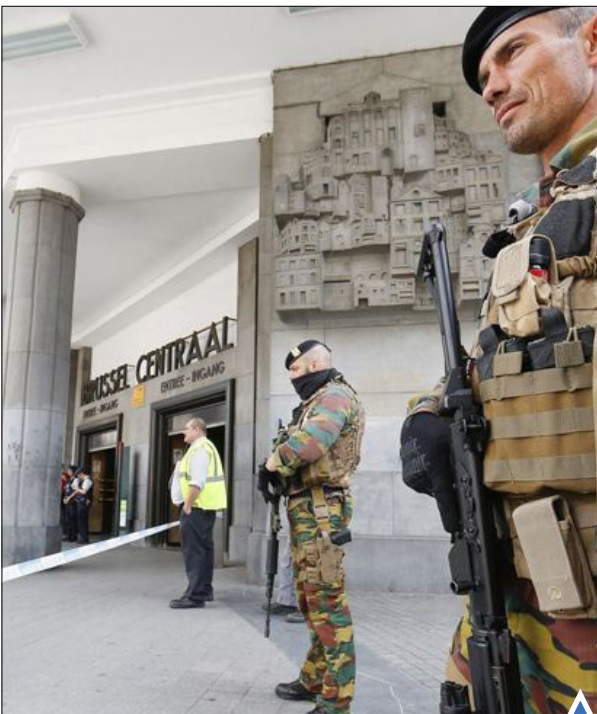
نگهبانی سربازان بلژیکی مسلح در مقابل ایستگاه مرکزی بروکسل پس از آن به دلایل امنیتی، تخلیه شد