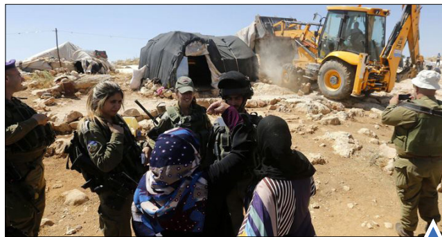
صحنه فلسطینی‌ها پس از تخریب خانه‌هایشان در نزدیکی روستای پاتا، جنوب الخلیل