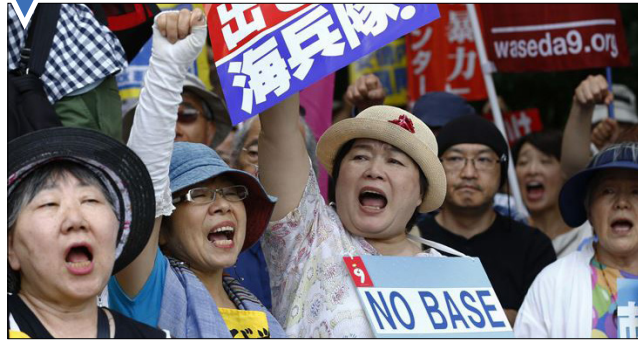
اعتراض ژاپنی‌ها به حضور پایگاه‌های نظامی آمریکا در جزیره اوکیناوا