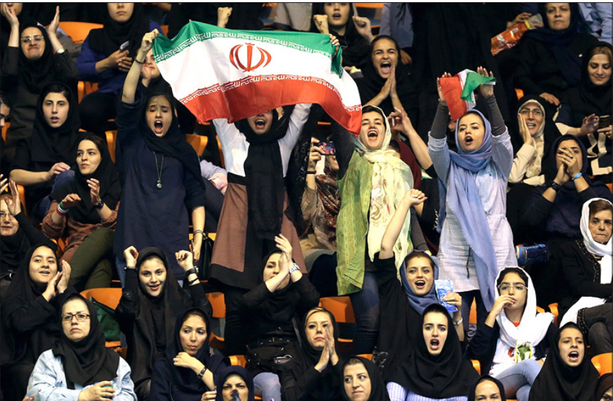
حضور بانوان در ورزشگاه در حاشیه دیدار ایران و صربستان