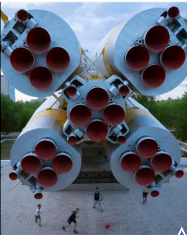
فوتبال پایین موشک سایوز نصب شده به عنوان بنای تاریخی در روسیه