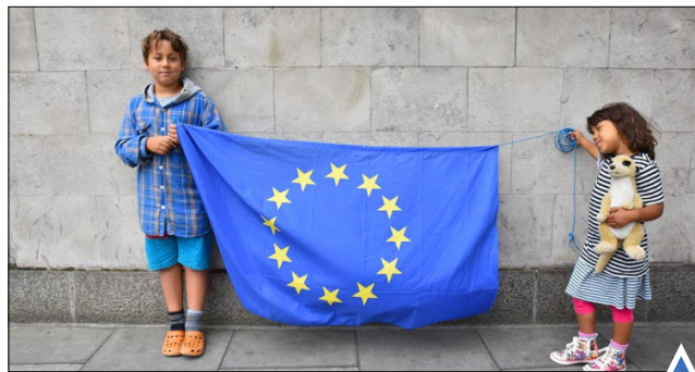
دو کودک با پرچم اتحادیه اروپا به نماد مخالفت با خروج انگلیس از اتحادیه؛ لندن هوایی فرانسه