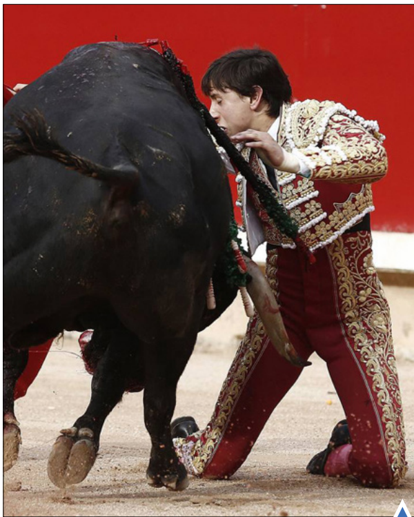
نبرد خونین ماتادور ۱۹ ساله و گاوخشمگین