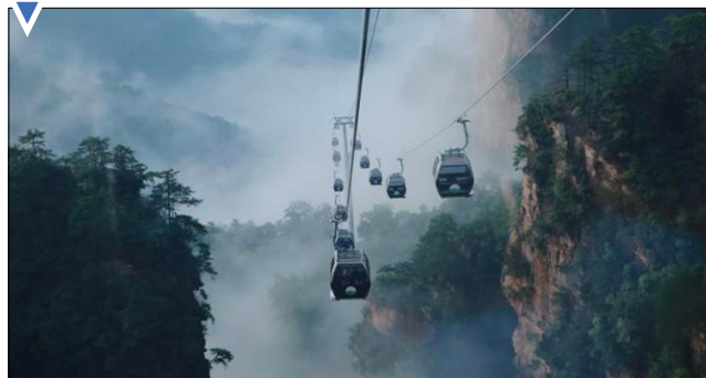
تله‌کابین سواری گردشگران در کوهستان تیانشی، چین