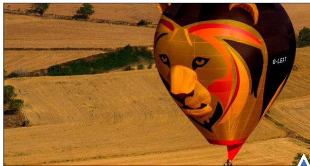
جشنواره بالن در ایگوالادا،