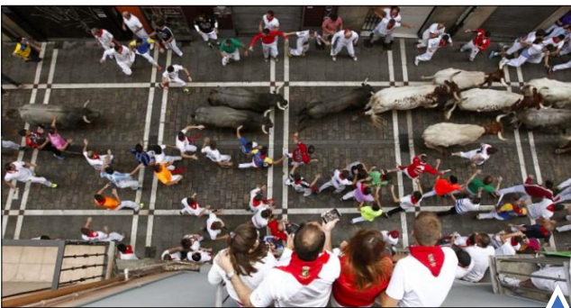
جشنواره سان فرمین در