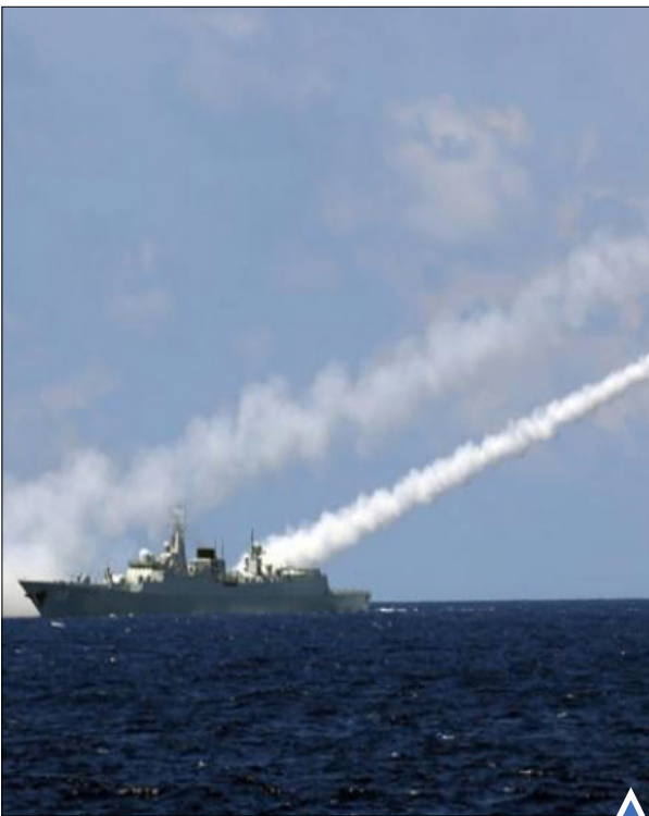
ناوشکن موشک انداز گوانگژو در تمرین نظامی، چین

کم‌دین پیتز کی هنگام تماشای مسابقات ویمبلدون، تماشاچیان را به سکوت دعوت می‌کند