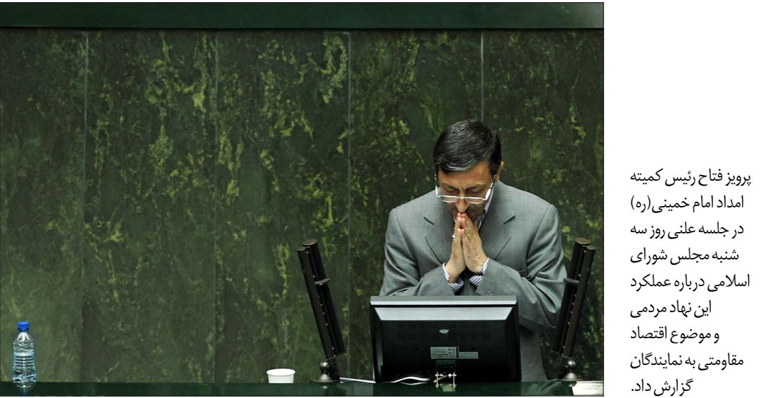
پرویز فتح رئیس کمیته امداد امام خمینی(ره) در جلسه علنی روز سه شنبه مجلس شورای اسلامی درباره عملکرد این نهاد مردمی و موضوع اقتصاد مقاومتی به نمایندگان گزارش داد.