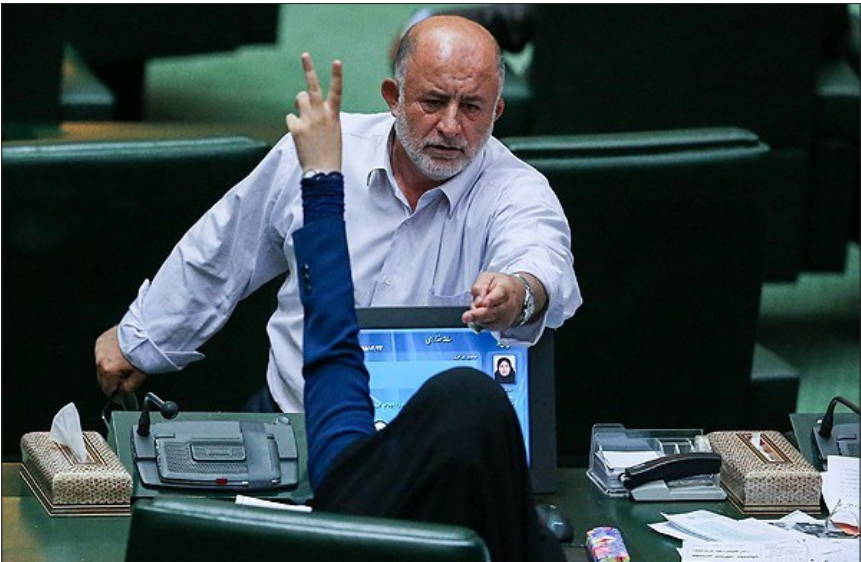
اعتراض نادر قاضی پور