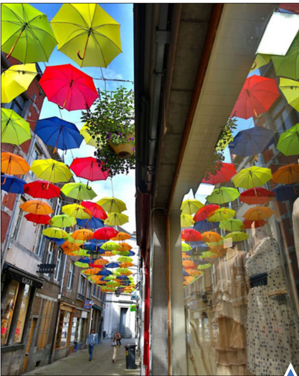
انعکاس چترهای رنگی در ویترین فروشگاه؛ نامور، بلژیک