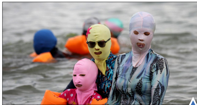
ورزش خانوادگی در

شاندونگ چی کشته شدن قندیل بلوچ، چهره شناخته شده رسانه‌ای پاکستان به دست برادرش