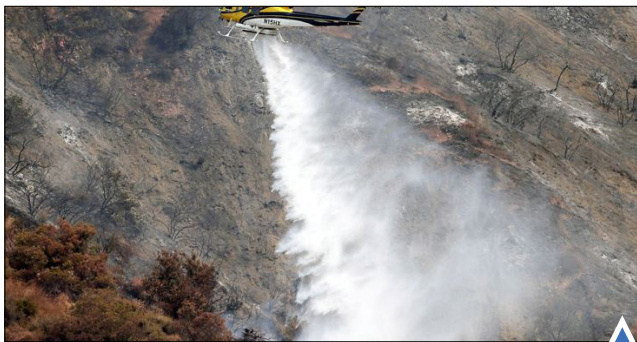
تلاش برای خاموش کردن آتش