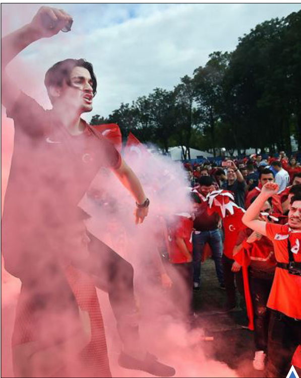
حامیان تیم فوتبال ترکیه در فرانسه