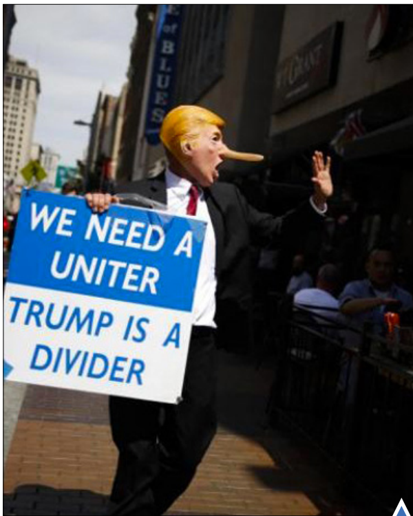
اعتراض به نامزد جمهوری خواه ریاست جمهوری در کیولند