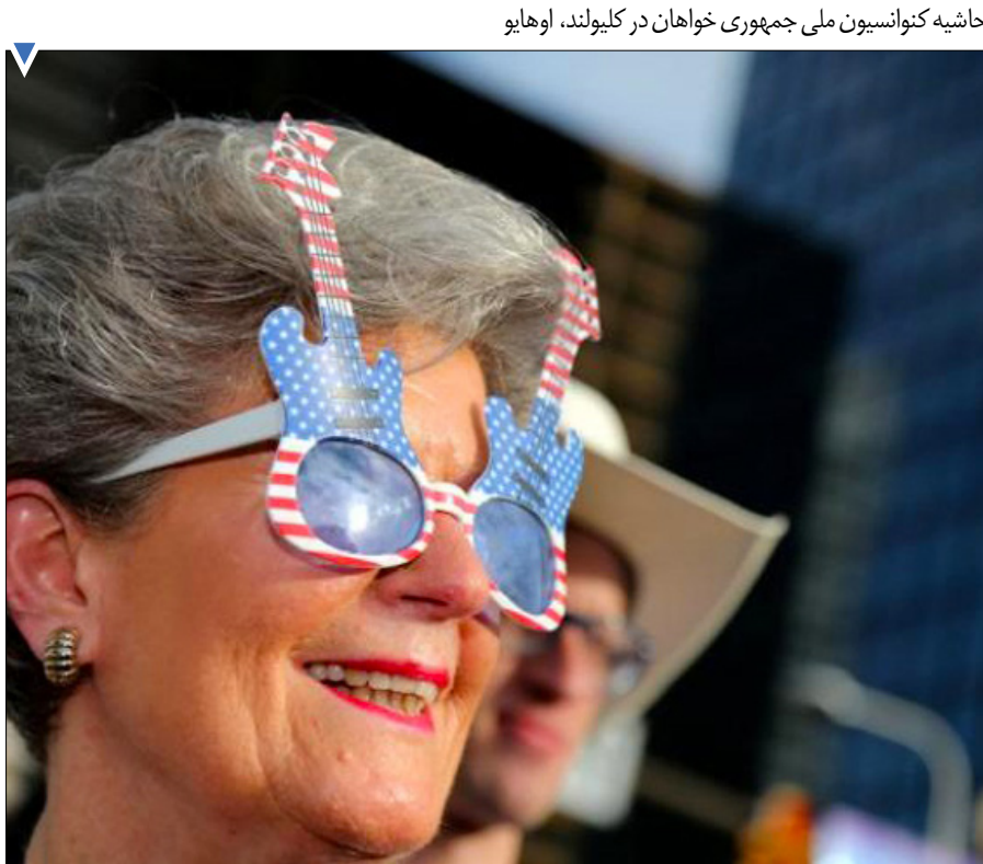
حاشیه کنوانسیون ملی جمهوری خواهان در کیولند، اوهایو