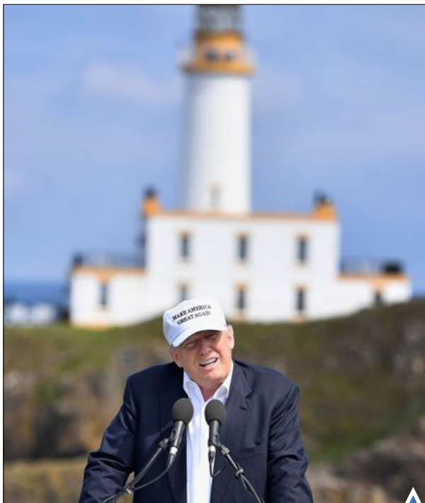
کنفرانس مطبوعاتی دونالد ترامپ، نامزد جمهوری خواه ریاست جمهوری آمریکا در ایر، اسکاتلند