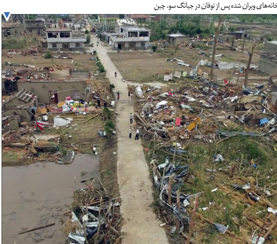
خانه‌های ویران شده پس از توفان در جیانگ سو، چین