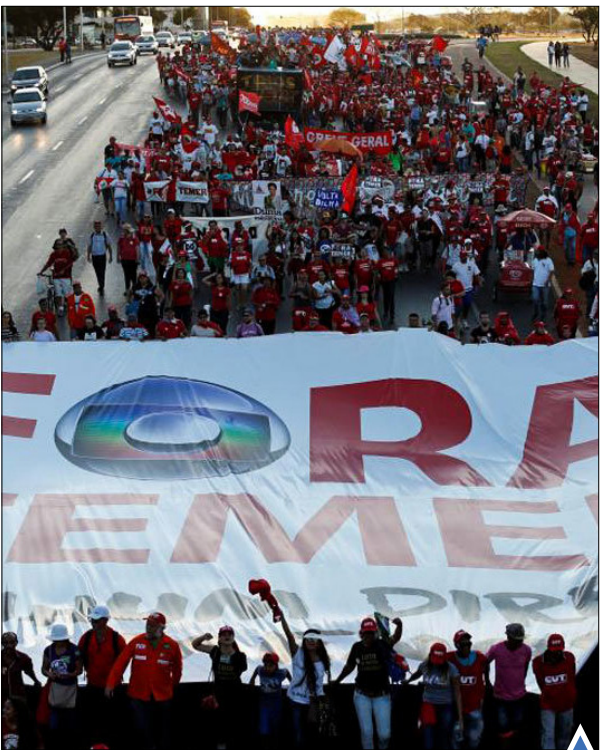
اعتراضات طرفداران دیلما روسف

یک سازمان بشردوستانه اسپانیایی، صدها مهاجر آفریقایی تبار را در نزدیکی سواحل لیبی از غرق شدن نجات داد.