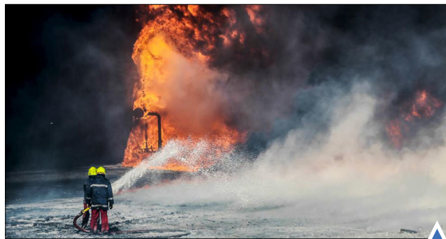
بازپس‌گیری مناطق نفتی از داعش