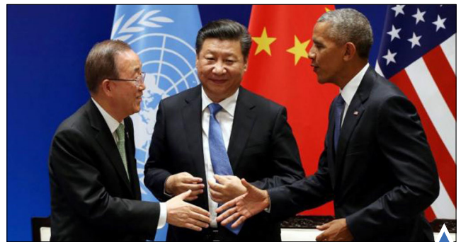
سفر اوباما به چین گذاره‌های مذاب در هاوایی