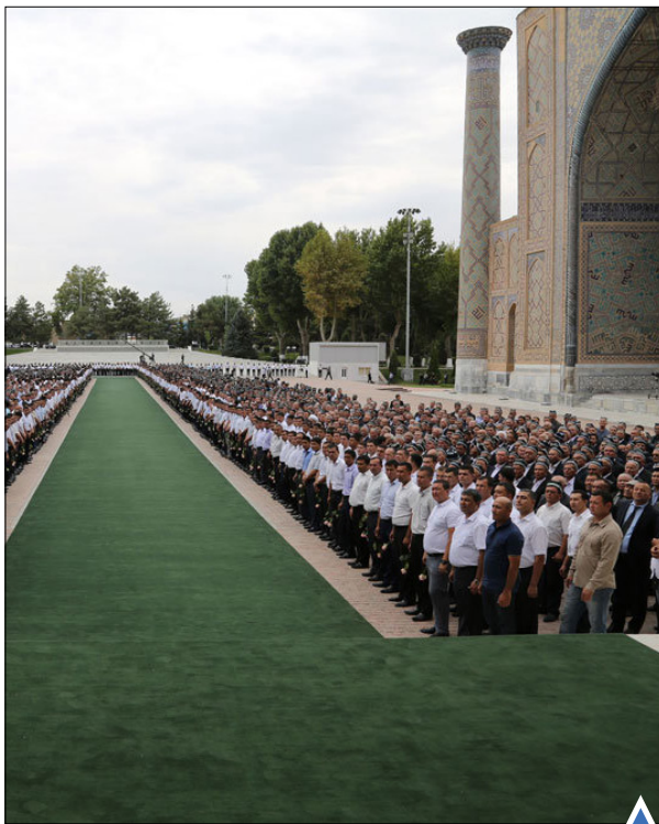
تشییع جنازه رئیس‌جمهور از پاکستان

بزرگترین پل شیشه‌ای جهان در چین ۱۳ روز پس از شروع به کار خود به دلیل تقاضای بالای گردشگران برای بازدید از آن بسته شد