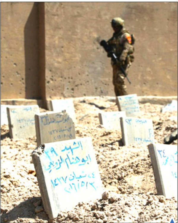
قبرستان فلوجه عراق بعد از حمله داعش