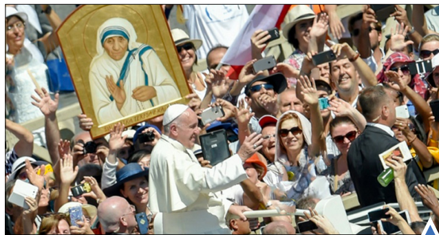
پاپ در میدان واتیکان نظارات برای صلح در استانبول