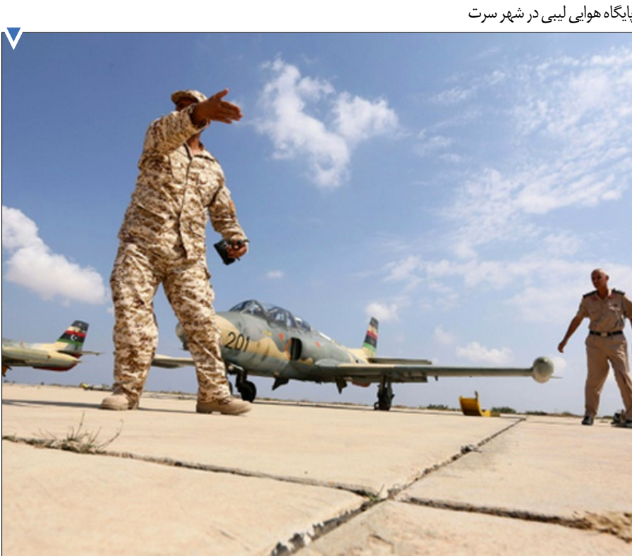
پایگاه هوایی لیبی در شهر سرت