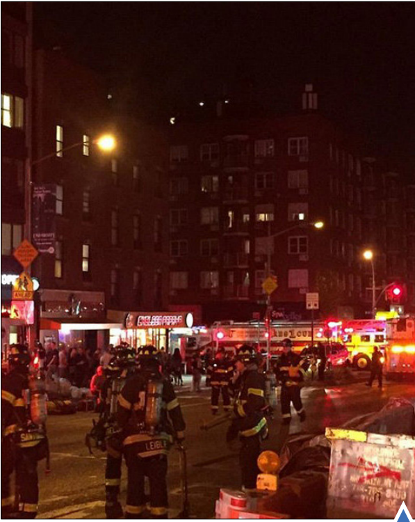
انفجار در نیویورک