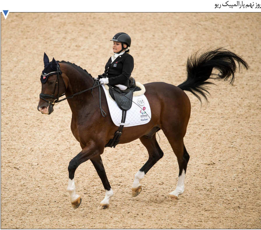
روز نهم پارالمپیک ریو