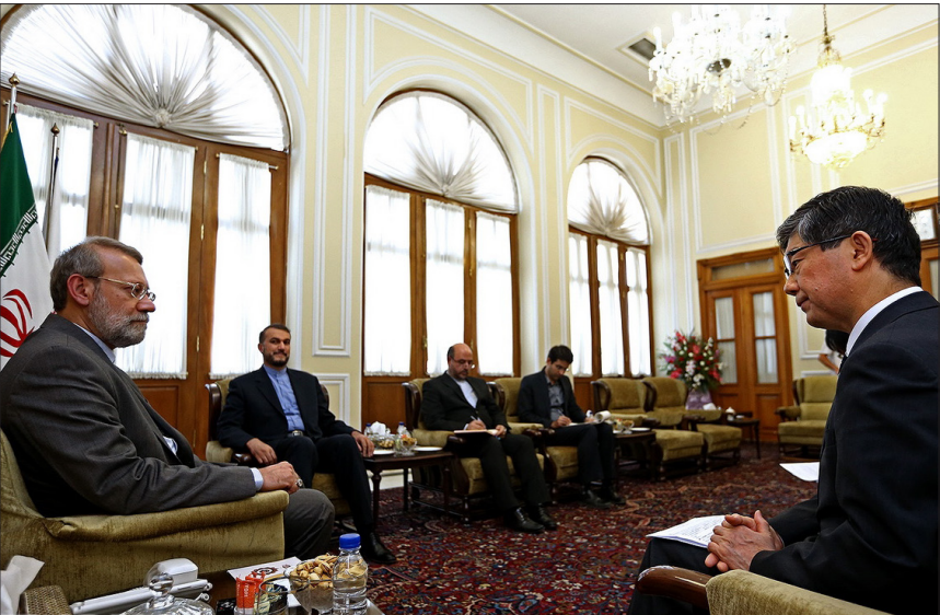
«کوباباشی» سفیر ژاپن روز دوشنبه با علی لاریجانی رئیس مجلس شورای اسلامی دیدار و گفتگو کرد.