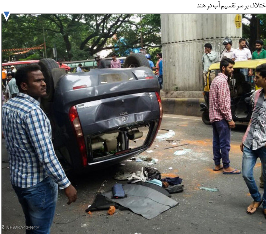
اختلاف بر سر تقسیم آب در هند