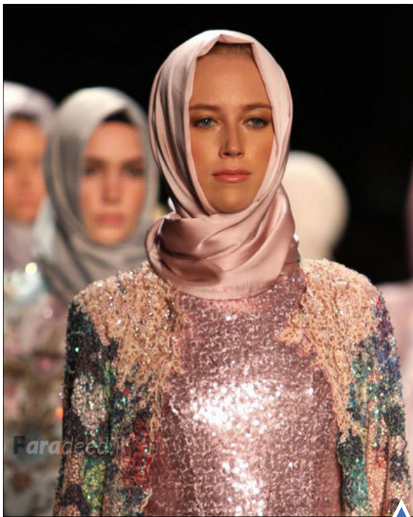
برگزاری هفته مد اسلامی در نیویورک