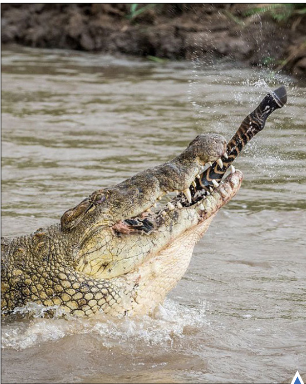
شکار گورخر به دست کروکدیل‌ها

تکیه با احداث سومین پل بر فراز تنگه بسفر، یک راه ارتباطی جدید بین دو قاره آسیا و اروپا ایجاد کرد.