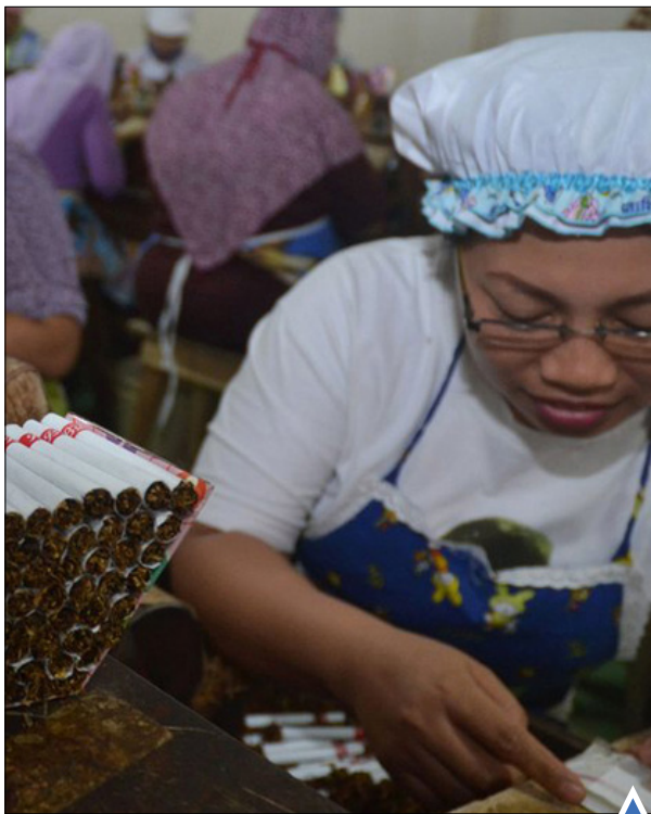
کار در کارخانه سیگار در شرق جاوا