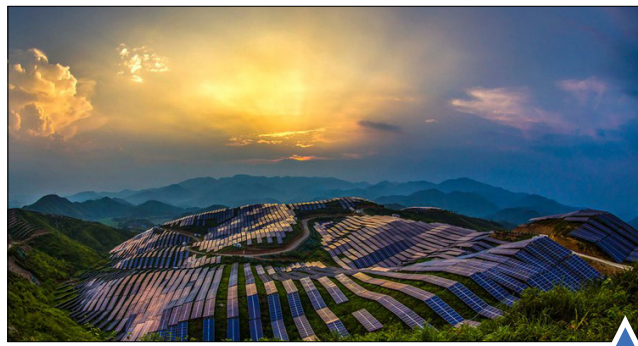
غروب بر فراز نیروگاه خورشیدی در چین