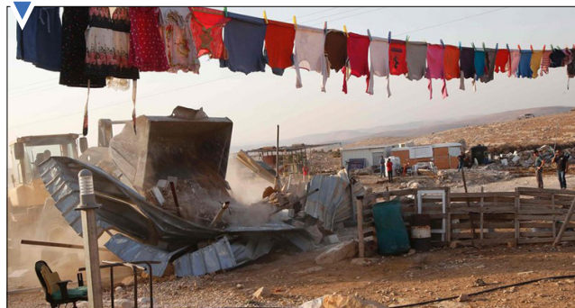
خراب می کنند