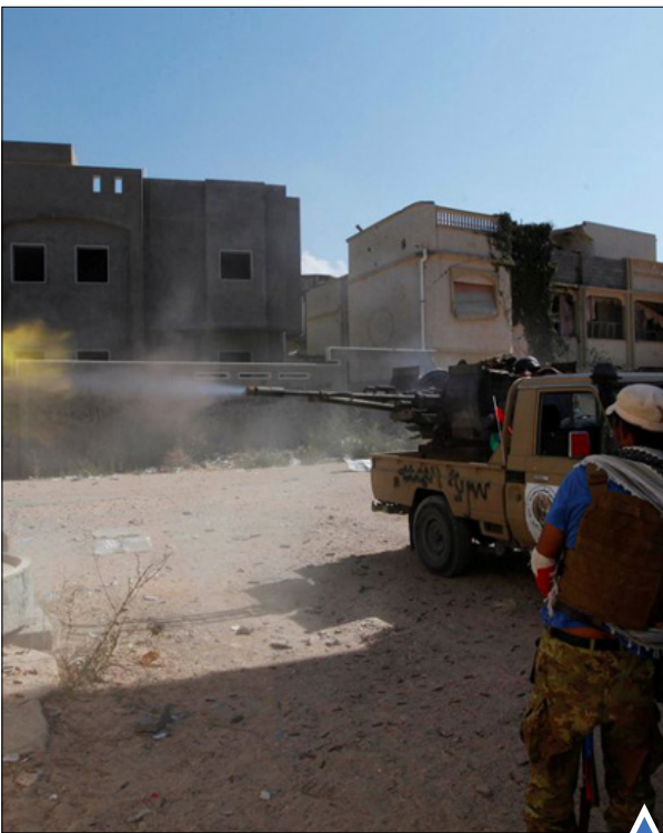
جنگ در لیبی

با فرارسیدن تابستان و فصل گرما، مردم بیروت برای آبتنی و تفریح به سواحل این شهر در کناره دریای مدیترانه می روند.