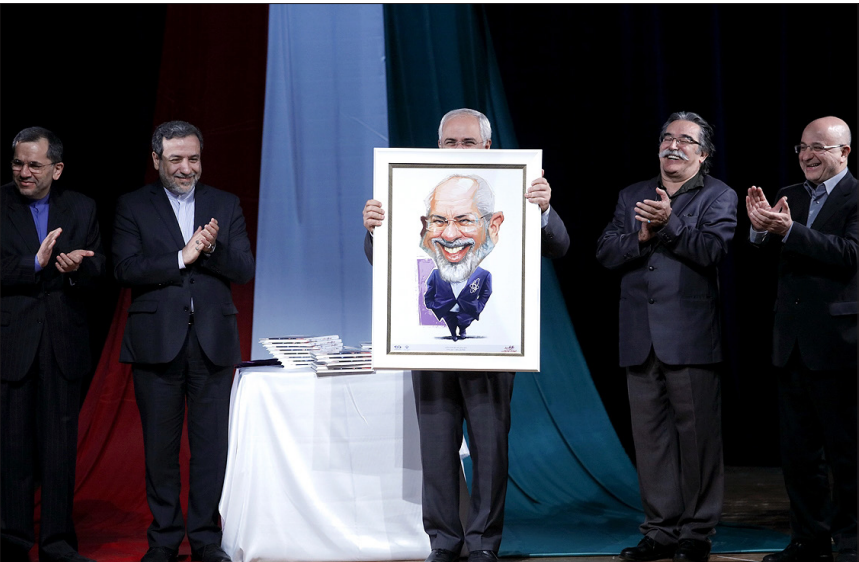
مراسم رونمایی از کتاب

حجت‌الاسلام والمسلمین علوی، با بیان این که در ایجاد امنیت باید در چارچوب اخلاق حرکت کرد گفت: باید به شخصیت و کرامت انسان‌ها که سرمایه و هدیه‌ای الهی است حرمت گذاشته شود و در چارچوب اخلاق اسلامی رفتار کرد لذا راه موفقیت جامعه هم از ارش‌های اخلاقی می‌گذرد.