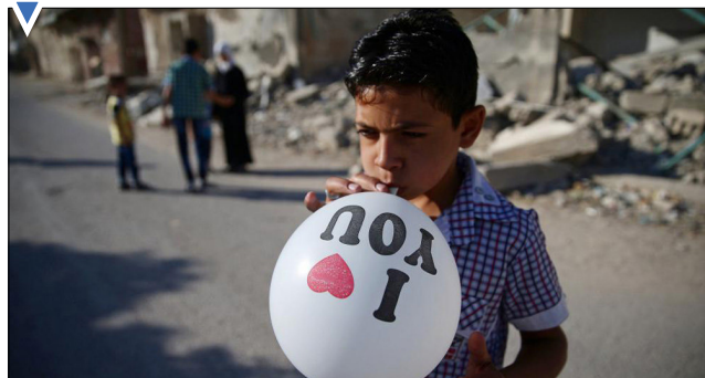
بازی های کودکانه در منطقه جنگی