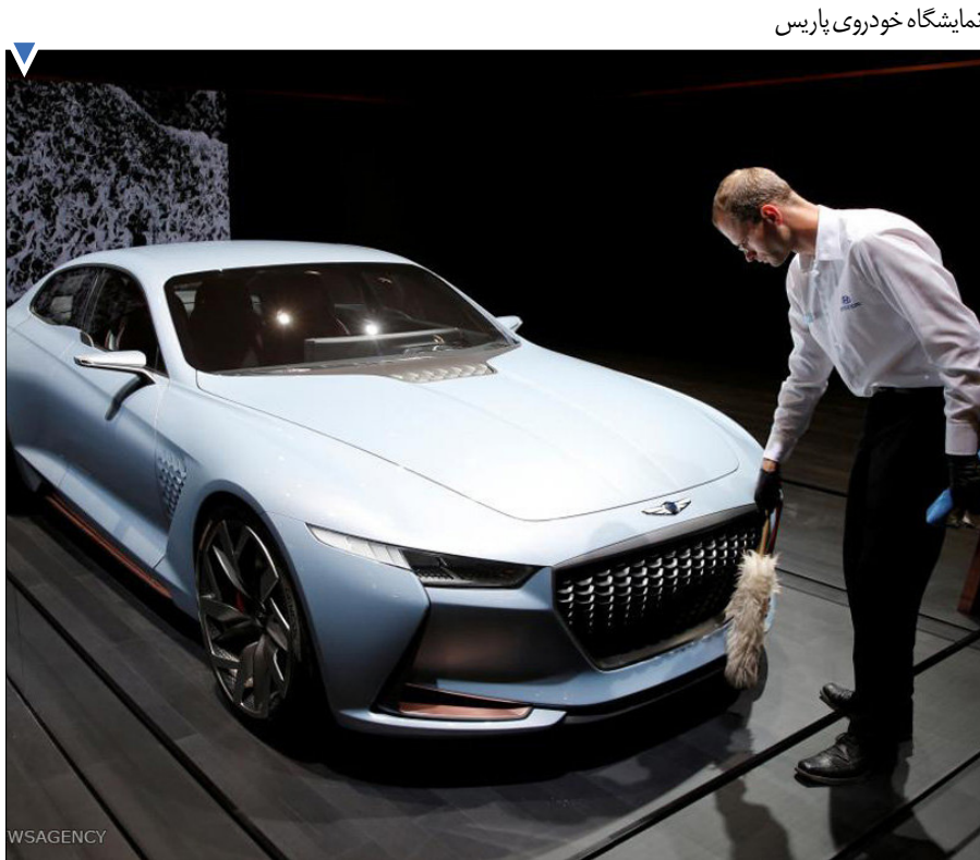
نمایشگاه خودروی پاریس