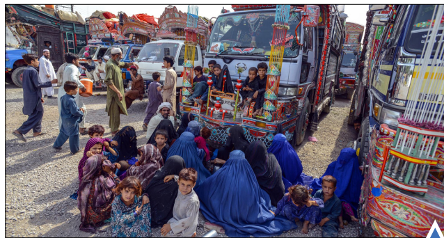
بازگشت آوارگان افغان از پاکستان