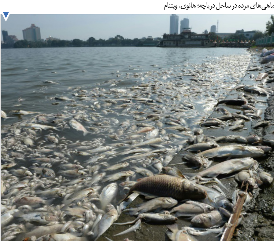
ماهی‌های مرده در ساحل دریاچه؛ هانوی، ویتنام