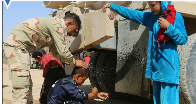
شست‌وشوی مردم فراری از داعش در ایست بازرسی؛ جنوب کرکوک