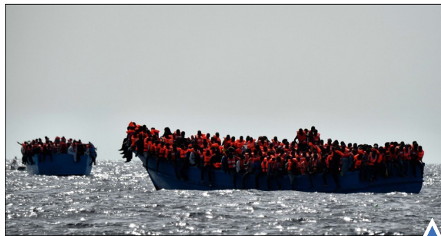
مهاجران روی دریای مدیترانه