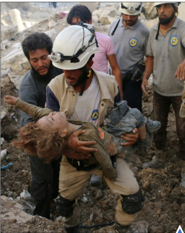
نجات کودک از زیر آوار؛ سوریه