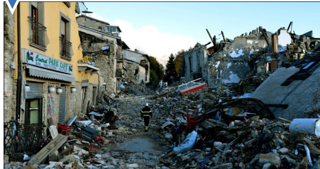
پس از زلزله