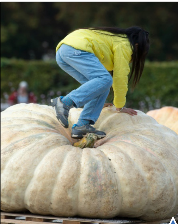
بالا رفتن از کدو تنبل در رقابت محلی؛ آلمان