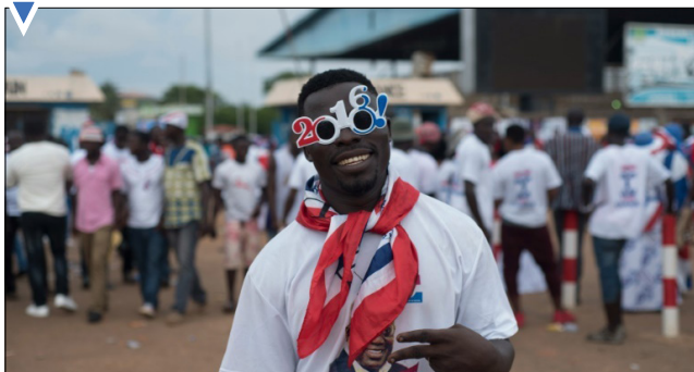
یکی از حامیان حزب مخالف در غنا