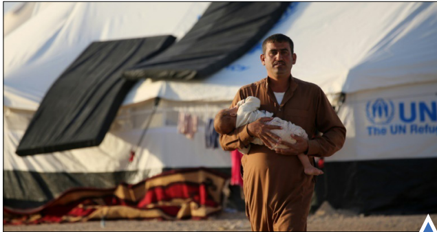
اردوگاه خانواده های فراری عراقی