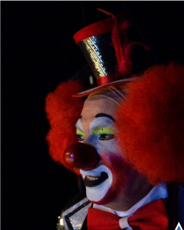
مجمع دلفک ها در مکزیکوسیتی