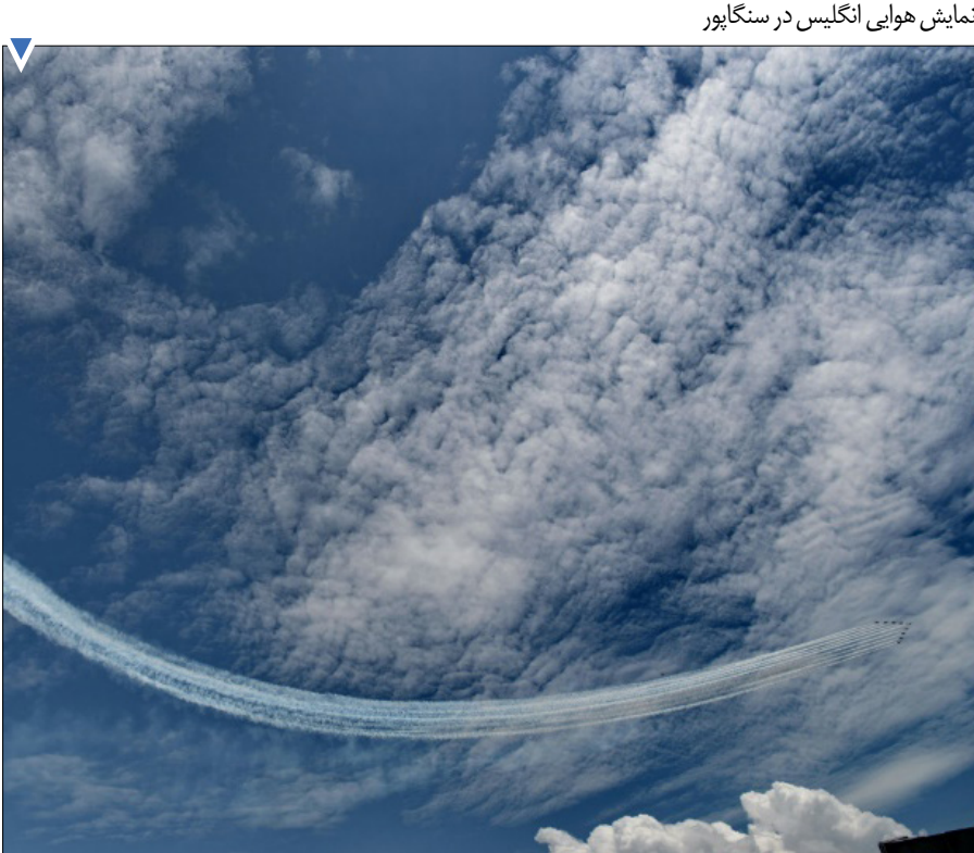
نمایش هوایی انگلیس در سنگاپور