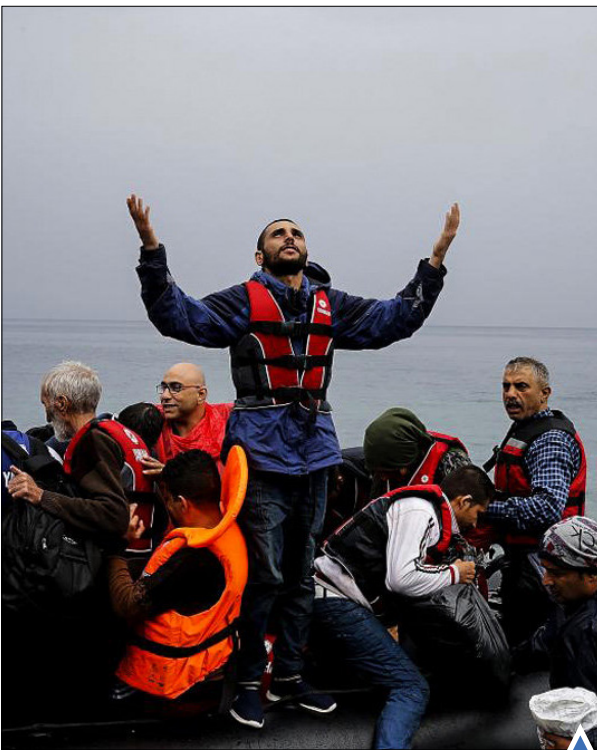
پناهجویانی که نجات یافتند