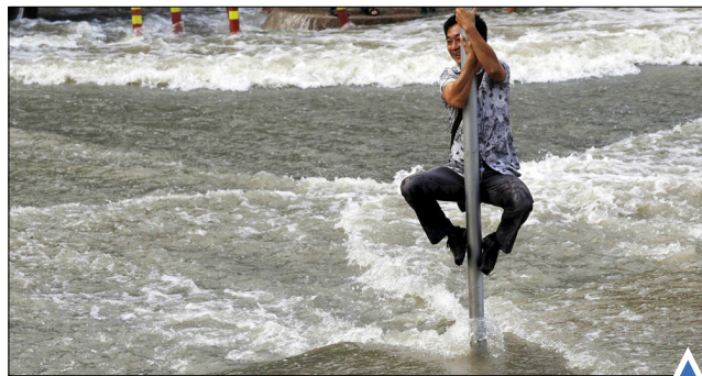
امواج خروشان رودخانه کیانتانگ چین