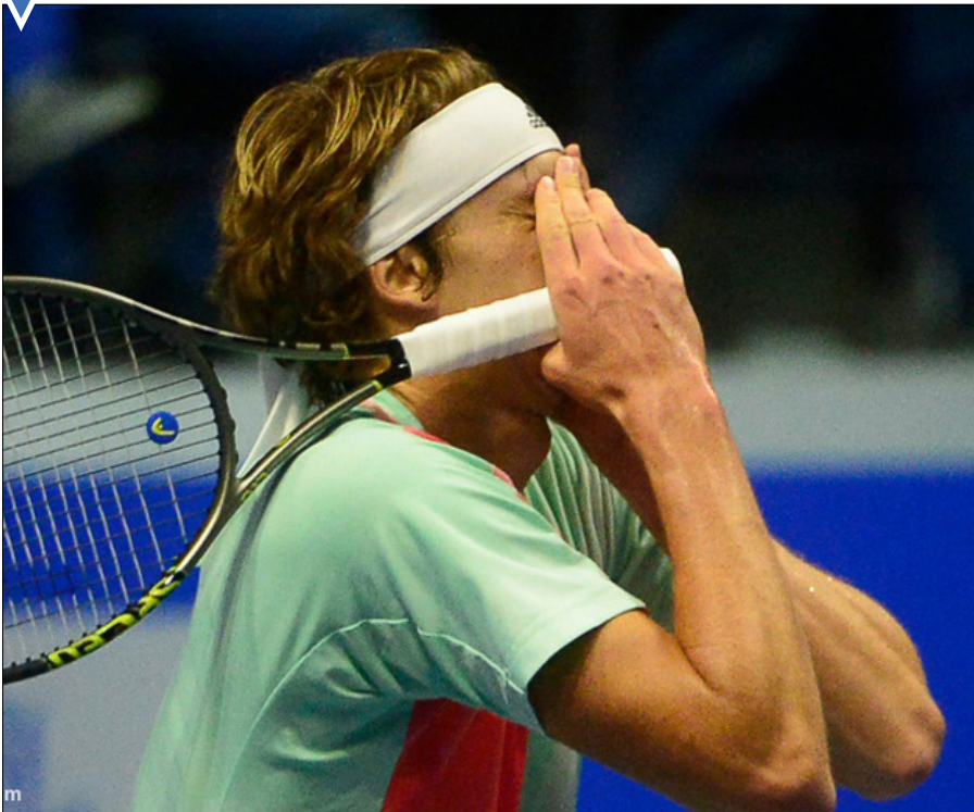
الکساندر زوراف پس از پیروزی در مسابقه تنیس در سن پترزبورگ