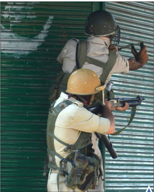
شلیک به سمت معترضان کشمیری