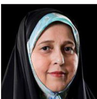
پروانه سلحشوری رییس فراکسیون زنان

در مجلس شورای اسلامی با اشاره به مشکلات گروه‌های مختلف اجتماعی، بر لزوم بکارگیری از زنان در سطوح بالای مدیریتی تأکید کرد و گفت: در نامه‌ای به رییس‌جمهور خواستار استفاده از